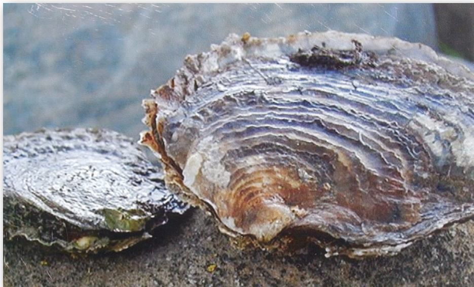
Østers fra Limfjorden betragtes mange steder i udlandet som verdens bedste.

Normalt eksporteres Limfjordens fine muslinger – i udlandet ofte betragtet som verdens absolut bedste – til restauranter i Sydeuropa, men det har coronakrisen sat en stopper for, fortæller TV MIDTVEST.