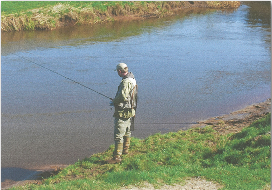
Bare det at nyde og afvente er en stor del af lystfiskeriets glæder som her ved Skjern Å.

Opgangsundersøgelsen i Varde Å viste en svag nedgang i bestandstørrelsen, hvilket også er reflekteret i fangsterne. Andelen af grilse er relativ høj. Det tyder på en forholdsvis god opgang af mellemlaks i 2020. Opgangen udgøres hovedsagligt stadig af udsatte laks i 2020.