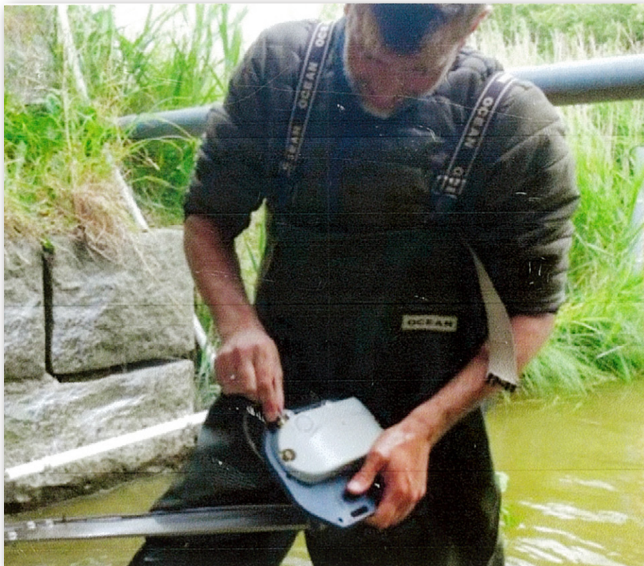
Måleinstrumentet er i denne lille grå æske fyldt med elektronik.

Hvor meget vand strømmer i åen? Det spørgsmål er vigtigt, når man skal finde ud af, hvor meget kvælstof og fosfor, der løber ud i fjorde og kystvande, hvor det kan give iltsvind.