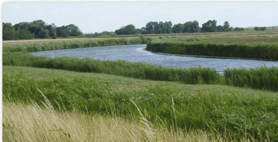
Vidåen er den sydligste af de otte vestjyske vandløb, og en del af strækningen danner den landegrænse til Tyskland.