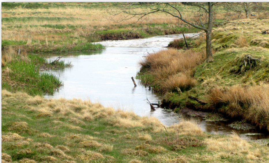
Skjern Å før sammenløbet med Rinds Å.

Laksen er som udgangspunkt fredet i otte vest- og sønderjyske vandløb, men med det gældende regelsæt om kvotesystemet kan Fiske- og Rystyrelsen give mulighed for, at lystfiskere kan hjemtage en