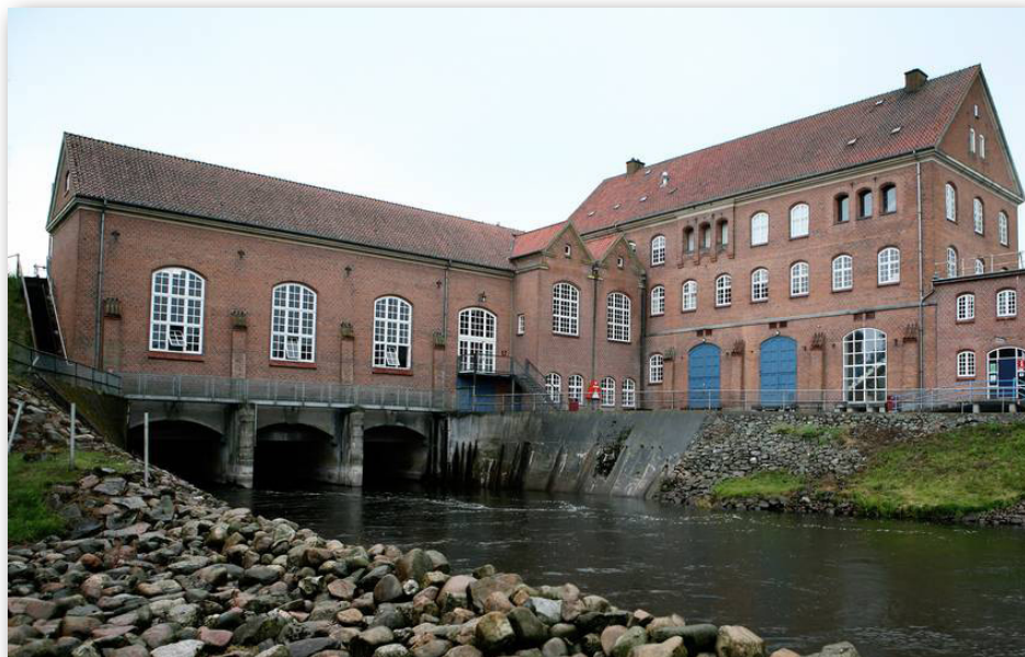
Det omstridte Tangeværk, som snart kan vente en endelig afgørelse om VVM-redegørelsen.

Senere på året i 2018 vurderede kommunen, at det pågældende projekt ikke nødvendiggjorde, at der blev udarbejdet en miljøvurderingsrapport (VVM). Det