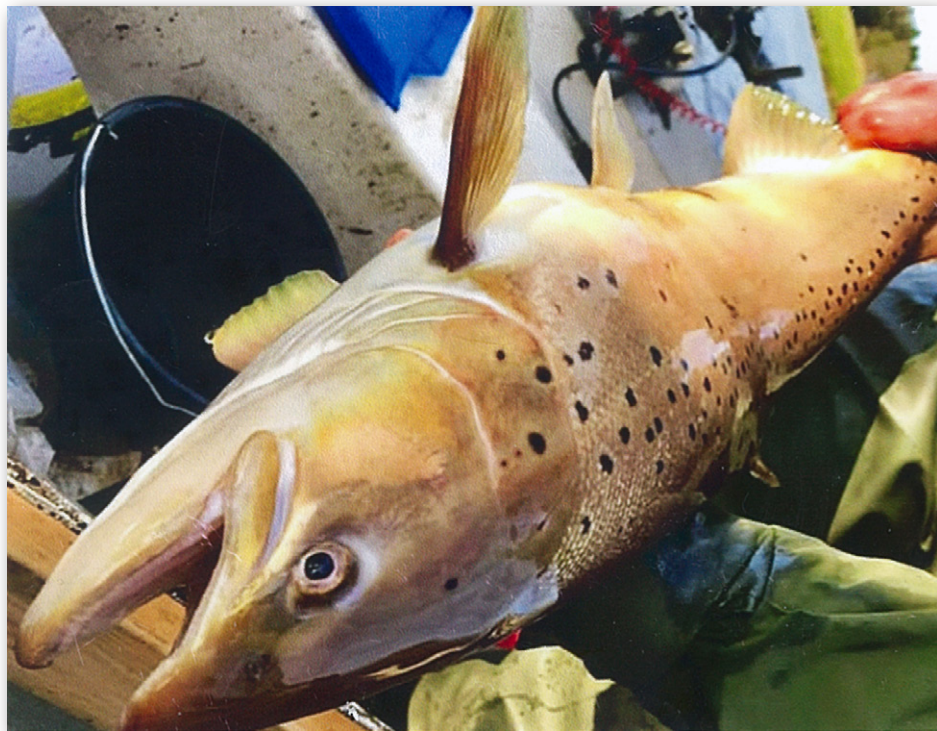
Skjern Å har givet mange flotte fangster af laks.

Desuden sikres det, at en eventuel usikkerhed ikke modvirker fortsat fremgang i bestandene. Hvis man ser tilbage på laksebestandenes udvikling og kvotestørrelse, har det været muligt at fastholde en meget stabil udvikling i kvoterne, samtidig med, at der er sket en kontinuerlig fremgang i bestandene og en stigning i antallet af naturligt reproducerede laks.