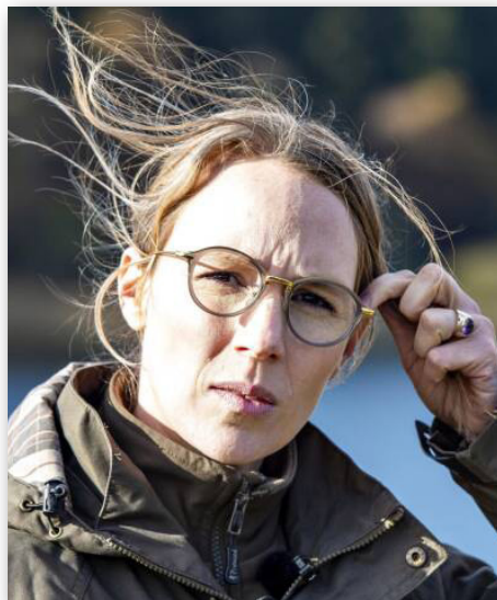
Miljøminister Lea Wermelin: - der er tale om en meget vigtig sag!

Ministeren erklærer selv, at netop denne spildevandssag er en "vigtig" sag for hende.