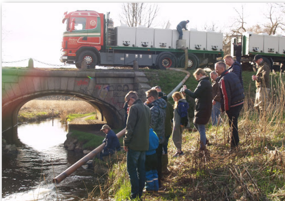
Ørredsmolt udsættes og følges med stor interesse.

Hvert forår udsætter frivillige fra lokale fiskeforeninger smolt i mundingerne af mange danske vandløb for at op hjælpe bestanden af havørreder. Smolt er små ørreder (10-20 cm.), der vandrer ud imod