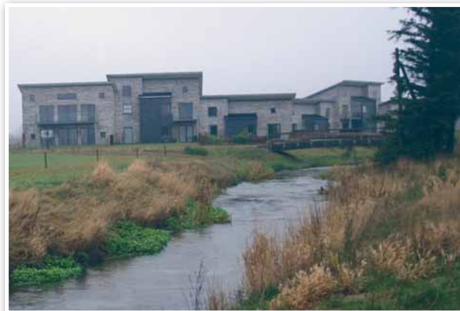
Det ender nok med, at man kan sidde i sin stue og kikke ned på de gydende laks.

ning. Siden kommune sammenlægningen for fem år siden, hvor Ringkøbing og Skjern Kommuner blev til en storkommune, har man gennemført 53 projekter, deriblandt flere ret så specielle og særprægede, enkelte