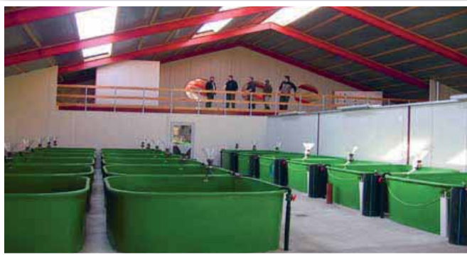
Kar til lakseyngel på DCV i Skjern.

DTU Aqua mener ikke, at Fiskeplejen bør medvirke til spredning af resistente bakterier, som kan udgøre en sundhedsrisiko samt risiko for den vilde