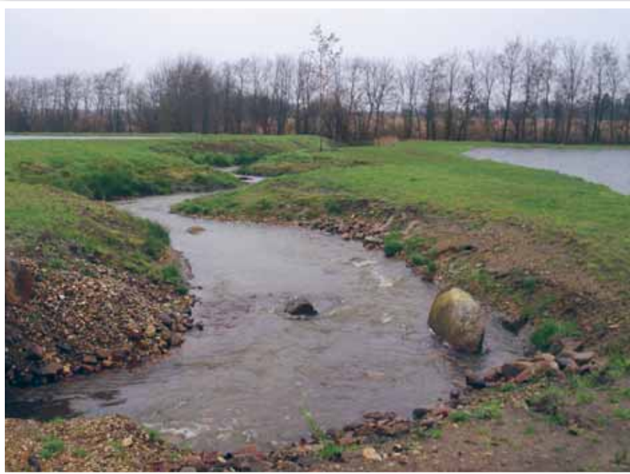
Her lå engang et produktivt dambrug, men vandløbets fisk havde problemer.

Projekter om kombineret okker- og kvælstoffjernelse, nye faunapassager, genslyngning af åløb, ombygning af eksisterende omløbsstryg, etablering af okkerrensningssøer, etablering af gydebanks, nedlæggelse af stemmeværker og kanalopfyldninger, restaurering af flere åløb med bl.a. genåbning af rørlagte vandløb, ja, man kunne blive ved med at nævne blandt de 53 projekter, der er gennemført indtil dato – og helt sikkert vil fortsætte ufortrødent også i de kommende år.