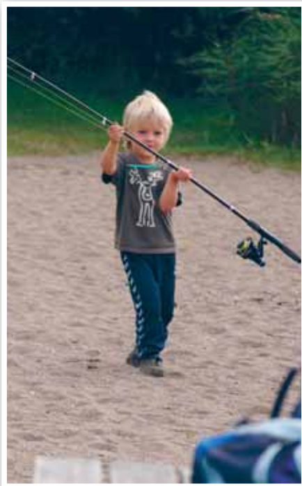
Kommunen håber med de mange fiskesteder at skabe en øget interesse for både fiskeri og naturen – også blandt de yngste.

Der oplyses bl.a. om pligten til at have lovpligtigt fisketegn, som administreres af Fiskeridirektoratet og kan købes bl.a. på alle landets posthuse. Ud over dette fisketegn, hvis beløb går til bl.a. udsætning af fiskeyngel og andre former for fiskepleje, kræver lystfiskeri i søer og vandløb også indløsning af