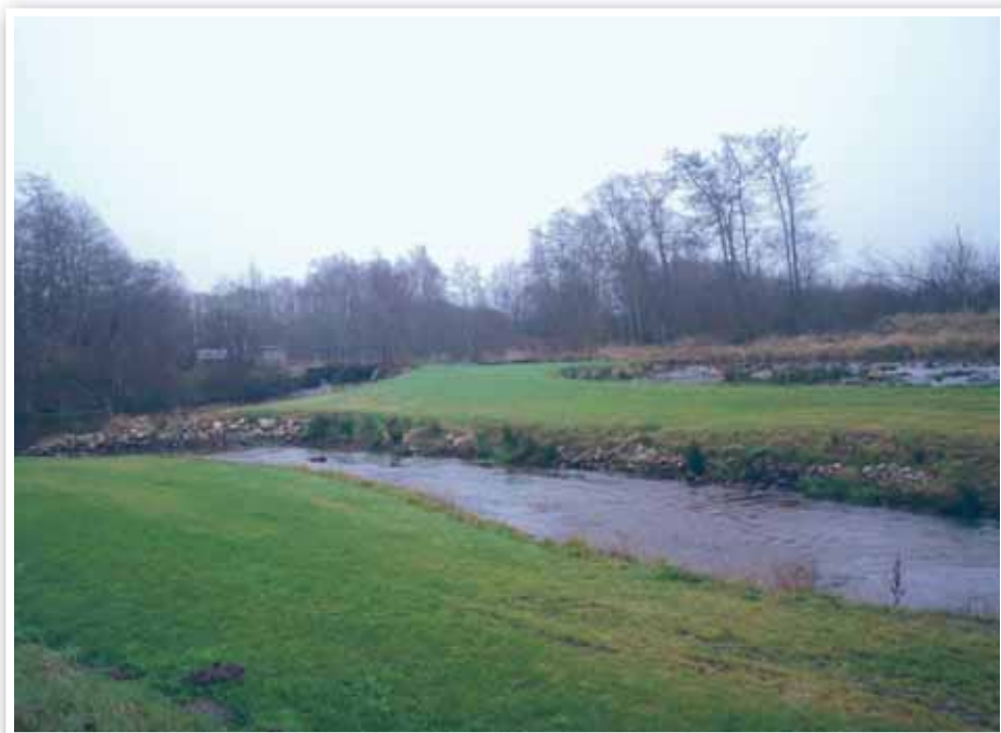
Hovens borgere har fået en naturperle efter endt genopretning.

vandre op i Simmelkær Bæk og Påbøl Bæk. Dertil kommer så, at der er skabt et rekreativt område til glæde for lodsejere og borgere i Hoven. Dette projekt har givet Hoven-borgerne lyst til at gå videre med et projekt, der omhandler en genopretning af den gamle mølledam. Til dette projekt er Hoven Erhvervs Invest har stillet 720.000 kr. i udsigt fra Fødevarer&Erhverv.