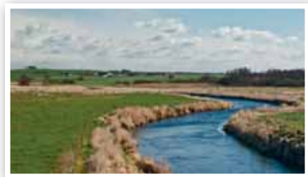
Lindenberg Å i Nordjylland – et af de højt prioriterede åløb i vandplanen.

–Den tidligere regering har desværre spildt alt for megen værdifuld tid på interne slagsmål og angst for særinteresser. Vi er derfor på forhånd to år