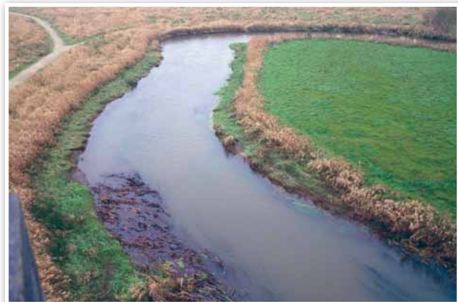
Flot udsigt fra de nye fugletårn over de genslyngede åløb.

For også at give borgerne let adgang til de nye naturområder er der i forbindelse med åløbenes genslyngning også